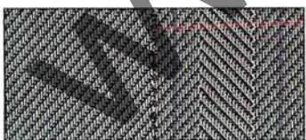
Grigio (260) esclusivo per HF