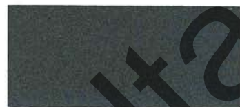
Green Park (355)