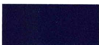
Blu Madras (429)