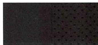
Nero (828) esclusivo per HF

* A richiesta con supplemento di prezzo (di serie su HF LS).