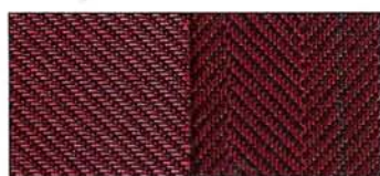
Rosso (210) esclusivo per HF