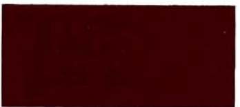
Rosso Coventry (158)