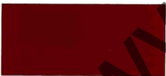
Rosso Monza (159)