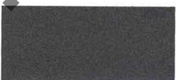
Grigio Memphis (637)